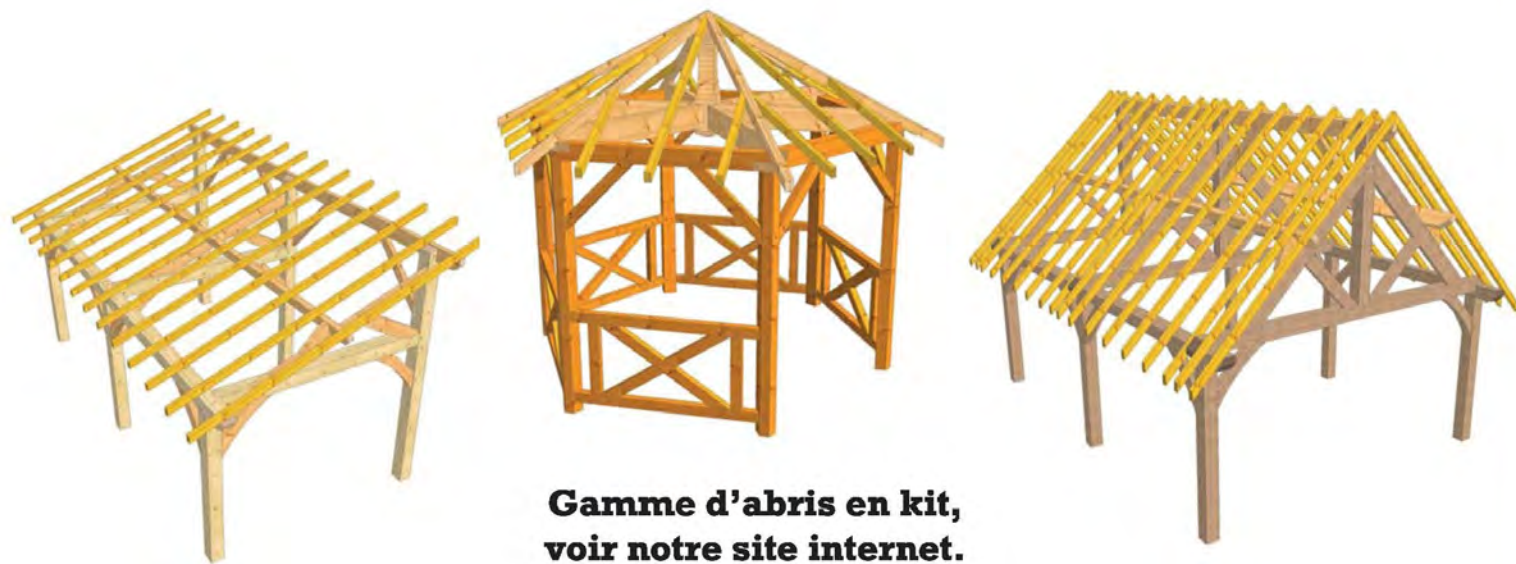
Gamme d'abris en kit, voir notre site internet.